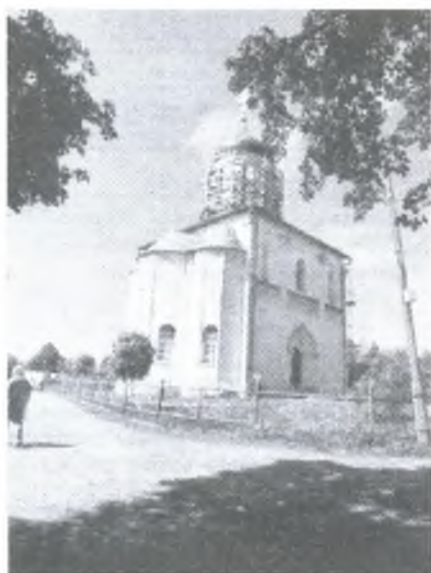
Фото 4. Звенигородский Успенский собор

Звенигород поразил нас своими соборами, церквями и монастырями. Звенигородский Успенский собор, куда привели нас наши гиды, был построен в 1390-х гг. князем Юрием Дмитриевичем. В настоящее время собор является одним из древнейших образцов раннемосковского зодчества. Уникальность его состоит как в хорошей сохранности, так и в том, что он никогда не подвергался серьезной архитектурной реставрации. Для создания живописного убранства храма была приглашена бригада иконописцев круга прп. Андрея Рублева. В соборе до наших дней сохранились фрагменты первоначальных фресковых композиций. Из собора происходят и всемирно известные иконы Звенигородского чина, авторство которых многие исследователи также отдают прп. Андрею Рублеву. В советское время храм был закрыт всего лишь около 10 лет. Это обстоятельство способствовало тому, что его убранство не было уничтожено, и сейчас храм является значительным хранилищем русской иконописи.