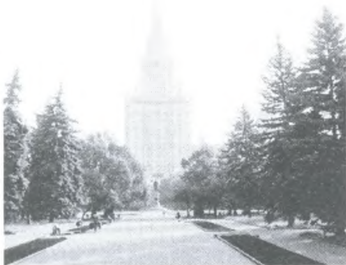
Фото 1. МГУ им. М.В. Ломоносова (май, 2010)