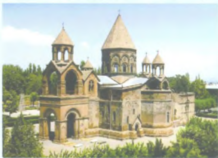
Кафедральный собор Эчмиадзина