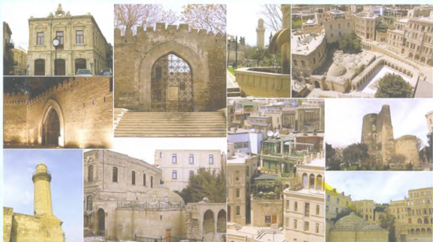
Баку. Старая крепость с Дворцом ширваншахов и Девичьей Башней