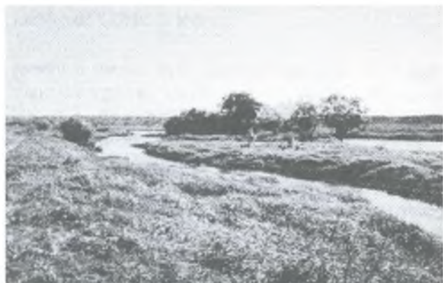
Фото 3. Москва-река

каменный мост. Но облик речной долины не изменился — он остался таким же, каким был в древности: с заливными полями и лесами, растущими на близлежащих холмах.